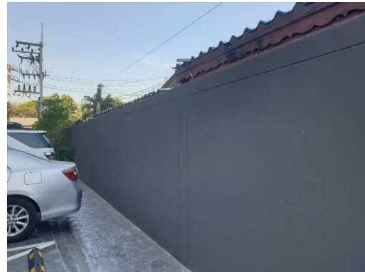
รูปที่ 3-1 รั้วคอนกรีตของโครงการ