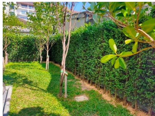
รูปที่ 3-11 การปลูกต้นไม้บริเวณข้างๆ อาคาร เพื่อช่วยบดบังแสงแดด