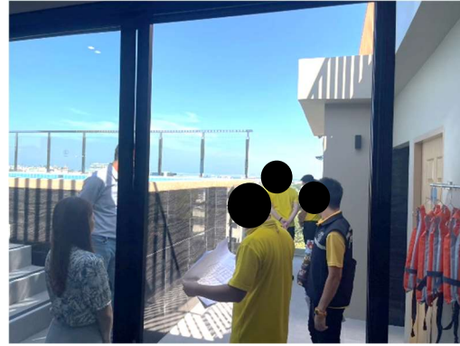
รูปที่ 3-4 เจ้าหน้าที่ของหน่วยงานอนุญาต เข้ามาตรวจสอบโครงการ