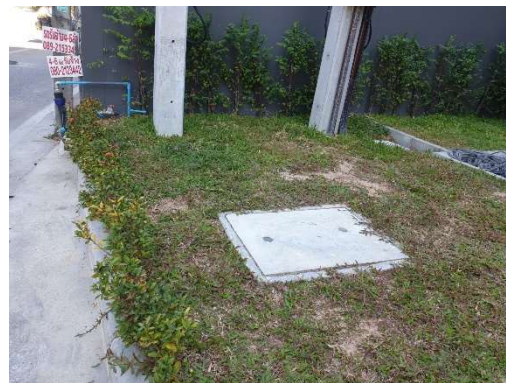
รูปที่ 3-9 ระบบระบายน้ำ