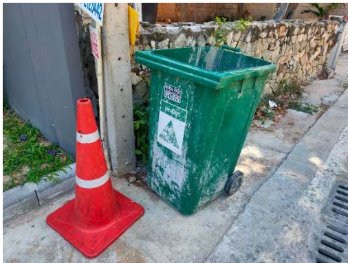
รูปที่ 3-13 ถังรองรับมูลฝอย