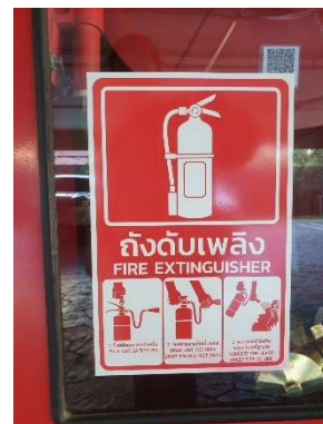
รูปที่ 3-15 อุปกรณ์ดับเพลิง