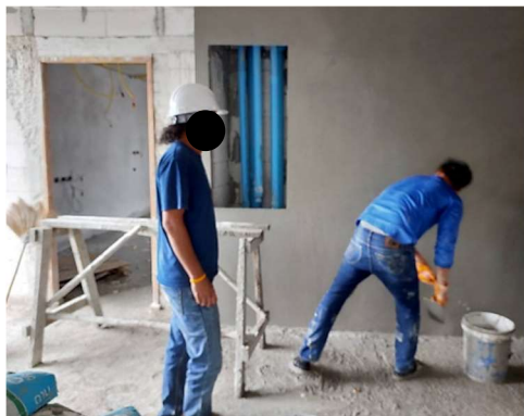
รูปที่ 3-8 วิศวกรควบคุมการก่อสร้าง