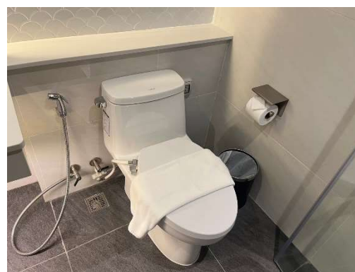
รูปที่ 3-10 ระบบบำบัดน้ำเสียและของเครื่องใช้สุขภัณฑ์ภายในโครงการ