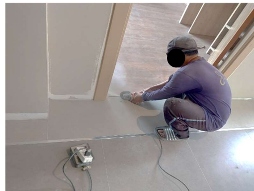
รูปที่ 3-6 การตัดเจียรเชื่อมโลหะงานตกแต่งอาคาร