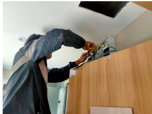
รูปที่ 3-14 การตรวจสอบระบบอุปกรณ์สายไฟ