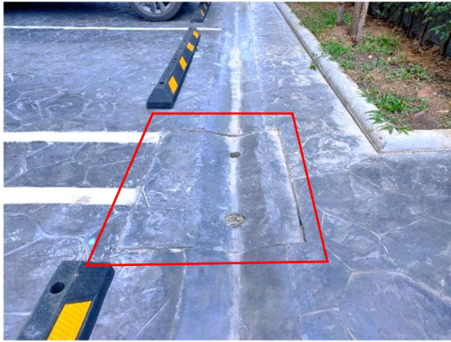
รูปที่ 3-3 การวางแผนระบบของโครงการ