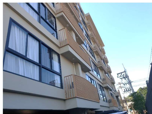
รูปที่ 3-2 สภาพปัจจุบันโครงการ