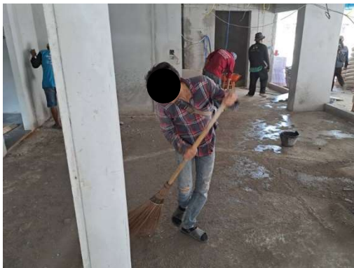
รูปที่ 3-5 พนักงานทำความสะอาด